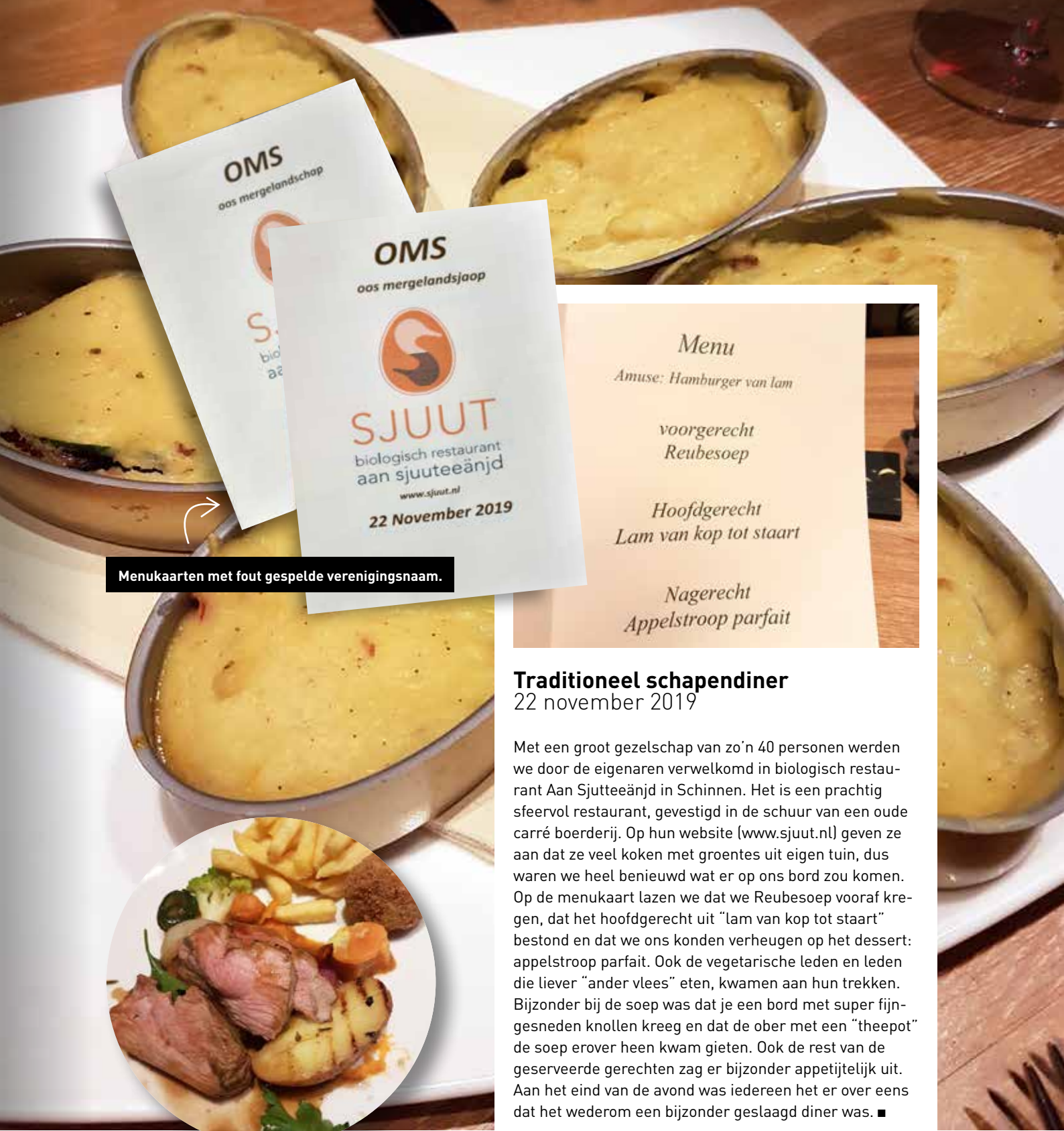
Menukaarten met fout gespelde verenigingsnaam.