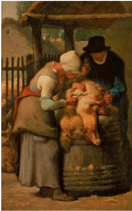
Tekst: Willem Eickmans