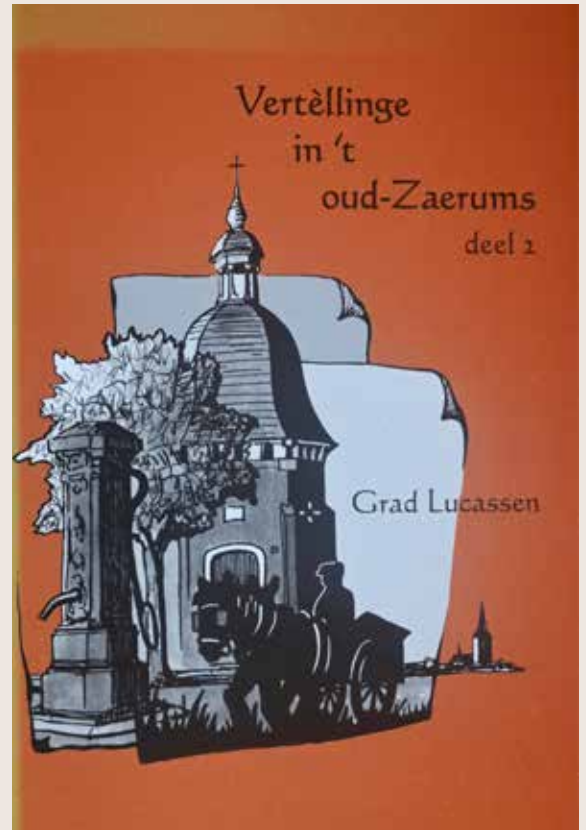
Vertèllinge in ‘t oud-Zaerums, deel 2, Grad Lucassen | Illustraties: Jan Althuizen

Wie haet schieëper Hannes nog gekènd? Wie haet van ‘m hure vertèlle? Wie wit wet van ‘m aaf? Has nemes, wèd ik. Dan wòrt ‘t hoeëgtiêd det we wet aover ‘m vertelle. Want heej is iëèn van de bekèndste schieëpers in de Zaerumse Pieël gewès. Vòr de aojere mingese irs nog èfkes det bekende liedje, det ge vrujer oppe schoeël zaeker gezónge hèt.